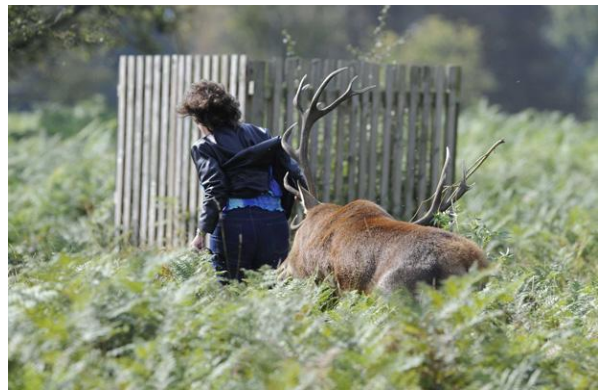
Une femme se fait attaquer par un cerf en rut dans Bushy Park, près de Londres, le 27 septembre 2011.

Une promeneuse, une petite fille, un cygne et maintenant un homme d'une cinquantaine d'années: les cerfs de Bushy Park, dans la banlieue de Londres, sont en rut et s'en prennent à n'importe qui. Dimanche soir, un promeneur a été attaqué dans le parc: un cerf l'a chargé et l'a violemment projeté à terre. Heureusement, des passants ont réussi à effrayer l'animal qui s'est enfui. L'homme n'a pas été blessé, contrairement à la petite fille attaquée en fin de semaine dernière qui souffre de plusieurs blessures légères.