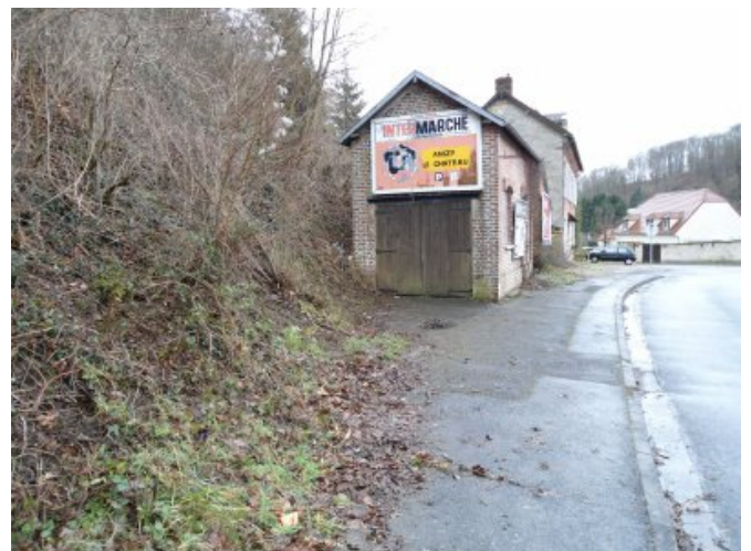
entre la maisonnette et la foret où se réfugia le cerf