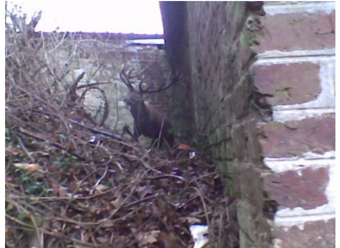
cerf fatigué, et apeuré pleurant sa liberté

D ela il a rejoint la foret en s'arretant et tourner la tete vers nous comme pour nous remercier, nous avons applaudis notre gloire. Mais cela ne reste pas sans rien, lundi je ferai tout pour contacter les journaux et la tv car la goutte d'eau a fait debordée le vase.