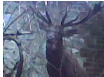
... sauvé d'une barbarie

Quelques véhicules se garèrent à 50 mètres de chez moi, ni une ni deux, je sortais de chez moi, allans vers les attroupements, arriver sur les lieux, quelques citoyens de la commune et des suiveurs ainsi que des chiens de la chasse à courre se trouver la.