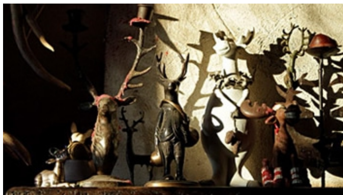
100% des Cerfs filmés sont sauvages et libres !

La première, celle du cœur, dispose d'une bande son et de la musique de Patrick Morin; elle est donc internationale et parle aux passionnés sans la barrière de la langue. Vous serez au milieu de la forêt et en plein brame dans votre salon. Prévenez vos voisins et la police que les rugissements qui traversent vos cloisons sont naturels... vous n'égorgez personne, ce sont les cerfs qui brament !